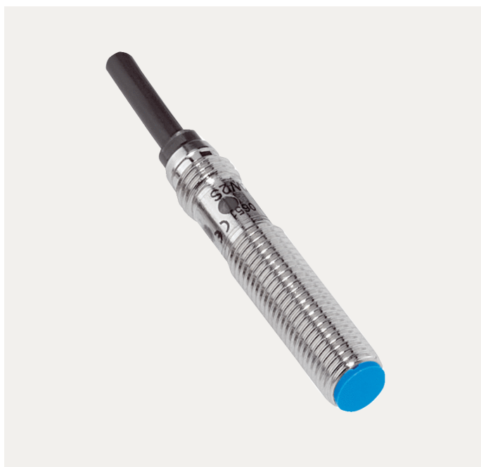
图片可能存在偏差